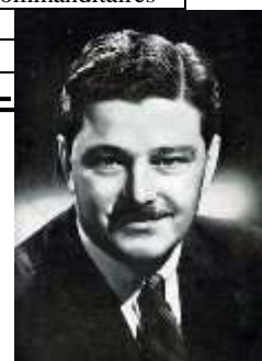
Paul Gérin-Lajoie 1920-2018

+ s'intéresser aux sujets abordés dans le magazine, car plusieurs mots-thématiques/verbes risquent de revenir dans la dictée...