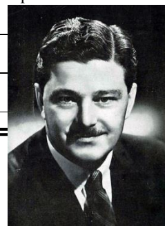
Paul Gérin-Lajoie 1920-2018